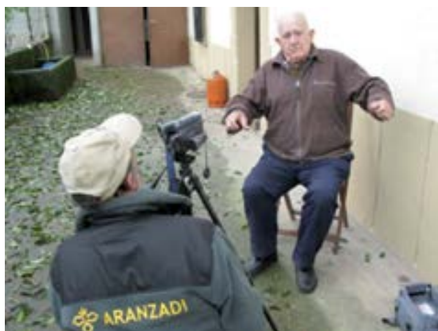
Recogida de testimonios

Todo ello, representa un compromiso y una responsabilidad que el Gobierno Vasco asume con los derechos de las víctimas. Este compromiso y esta responsabilidad se plasman en hechos concretos: avanzar en el proceso de exhumaciones para la búsqueda e identificación de personas desaparecidas.