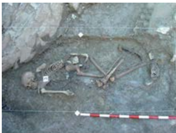
Exhumaciones - Elgeta

Con posterioridad, dicho documento técnico será complementado con el correspondiente informe del análisis de los restos encaminado a la identificación de los mismos y a la determinación de las causas de su muerte, que será realizado en los laboratorios especializados en la materia.