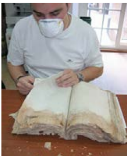
Investigación de archivos

En este contexto, con la declaración efectuada por el Lehendakari Juan José Ibarretxe en fecha 10 de Diciembre de 2002, el Gobierno Vasco puso en marcha una política activa de recuperación de la Memoria Histórica. En el año 2003 y mediante la intervención experta de la Sociedad de Ciencias Aranzadi, la Dirección de Derechos Humanos puso en marcha un plan de investigación sobre las personas represaliadas, fusiladas y desaparecidas en la Guerra Civil, la del Gobierno Vasco.